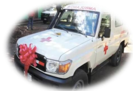
Ambulancia valorada aproximadamente $ 55,784